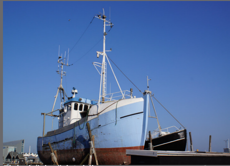
Fiskebåd på bedding