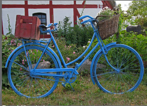
Den blå cykel