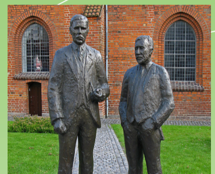
Johannes Larsen og Fritz Syberg