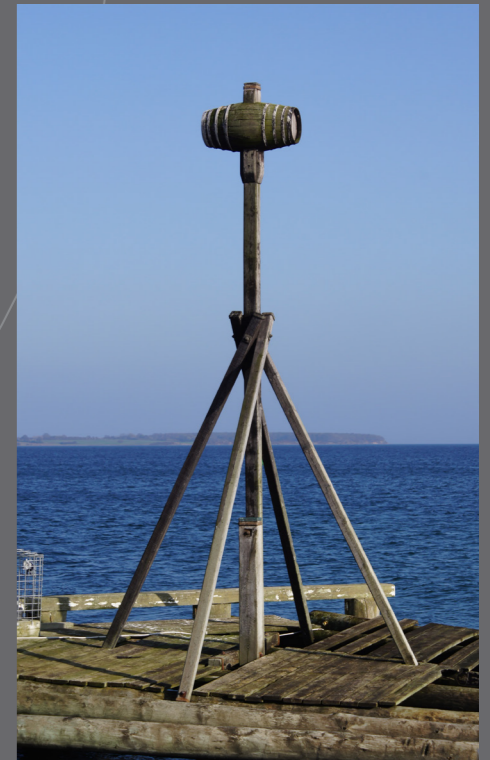
Udsigt ved Storebælt

"Kløversymbolet" Startstedet for Kløverstjerne findes på Hans Schacksvej, mellem Rådhuset og Turistbureauet.