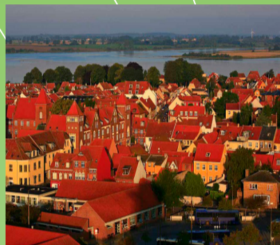
De røde tage

I 1413 fik byen købstadsprivilegier, som den sidste by på fyn. I middelalderen og renæssancen havde byen som udskibningshavn for Odense, stor søhandel og dertil godt fiskeri. De rige købmænd opførte i Langegade og ved havnen store købmansgårde i bindingsværk. Endnu rester en håndfuld af disse bygninger. Middelalderens omfang udgør stadig byens centrum, nu med huse med markante røde tegltage. De sammenbyggede huse i én til tre etager, og med aflange grunde, udgør byens charmerende og bevaringsværdige kerne.