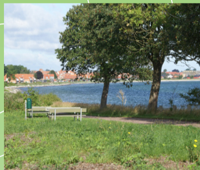
Udsigt fra Klinten