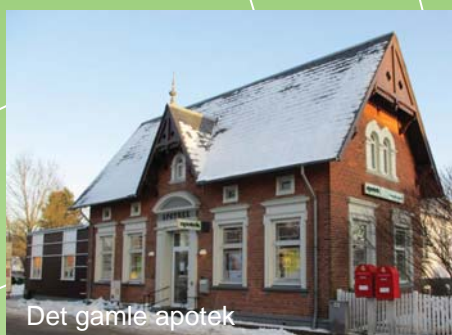
Det gamle apotek