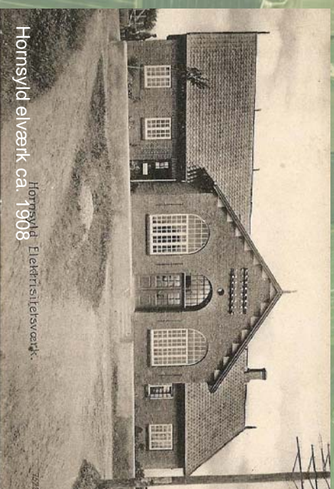
Hornsyld elværk ca. 1908