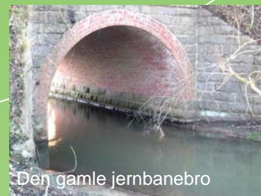
Den gamle jernbanebro

Af andre lokale seværdige punkter der passerer på ruten er Bråskov Købmandsgård, Efterskolen Bråskovgård og Brå Mølle.