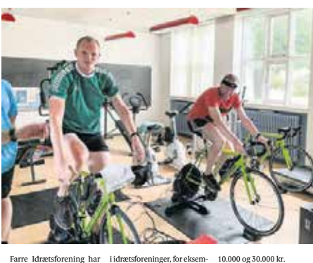
Farre Idrætsforening har modtaget bevilningen på 10.000 og 30.000 kr. De to midter kommer fra DIF og DGI's foreningspulje.

Med støtte fra DIF og DGI's foreningspulje kan Farre Idrætsforening nu sætte gang i eSport/Fitness på Hometrainer, som handler om indendørs cykling