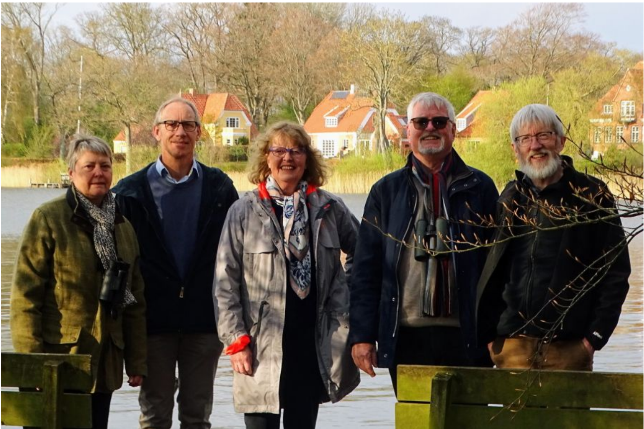
Bestyrelsen i Friluftsrådet Sydvestsjælland d. 24. april 2023 i Feldskoven med Egevangen i Sorø i baggrunden.