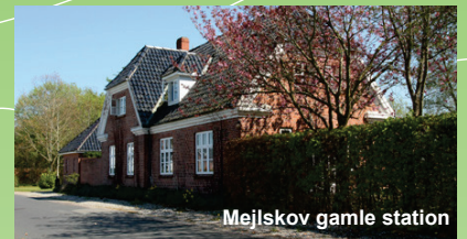
Mejlskov gamle station