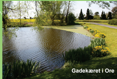
Gadekæret i Ore