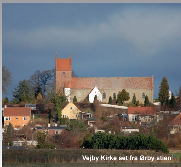
Vejby Kirke set fra Ørby stien