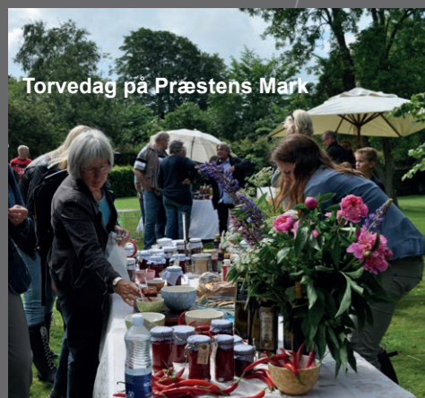
Torvedag på Præstens Mark

Se også ruterne ved at gå ind på www.kløverstier.dk . Her kan du også finde Kløverstier i resten af Danmark.