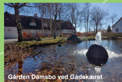
Gården Damsbo ved Gadekæret

Mange af byens vejnavne vidner om byens fortid som bondeby med store gårde langs vejen og Vejby er stadig omgivet af marker til alle sider. Vejby betyder simpelthen 'byen ved vejen'.