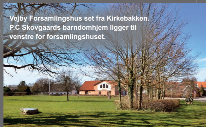
Vejby Forsamlingshus set fra Kirkebakken. P.C Skovgaards barndomshjem ligger til venstre for forsamlingshuset.