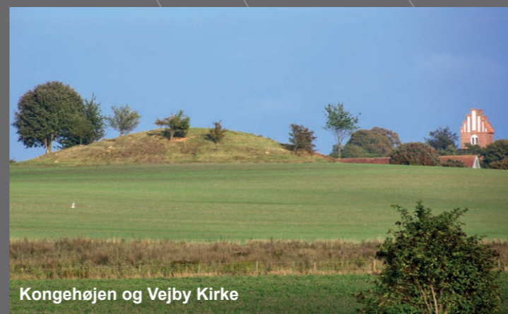
Kongehøjen og Vejby Kirke

Du kan også besøge vores hjemmeside www.vejbyliv.dk og læse om alle ruterne interessepunkter.