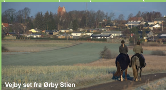
Vejby set fra Ørby Stien

Det ses tydeligt, at Vejby er en gammel by, når man kommer kørende fra Kildevejen, hvor man både kan se en bronzealderhøj, Kongehøjen, og Vejby Kirke, der hæver sig op over byen. Kirken er en såkaldt vejkirke, der er åben alle hverdage.