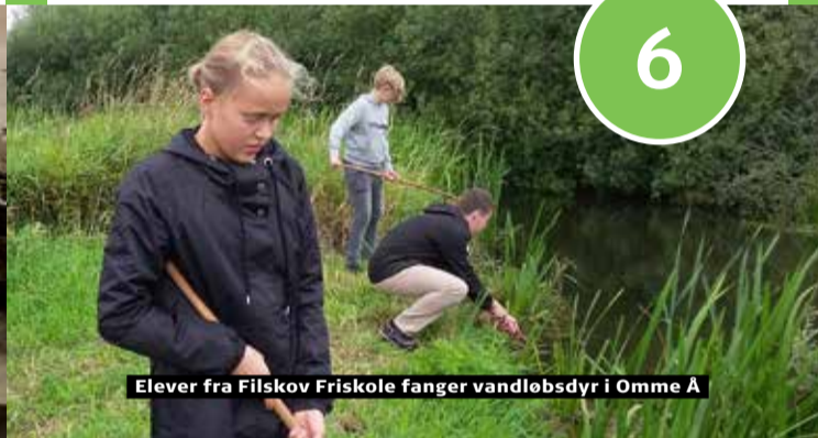
Elever fra Filskov Friskole fanger vandløbsdyr i Omme Å