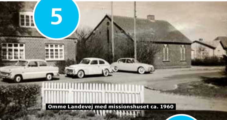
Omme Landevej med missionshuset ca. 1960