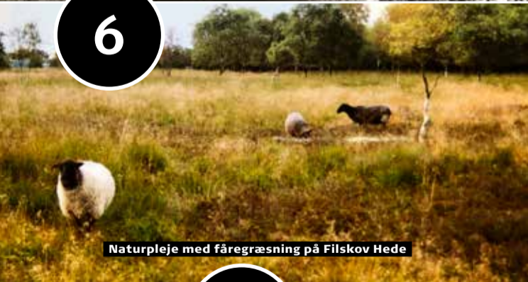
Naturpleje med fåregræsning på Filskov Hede