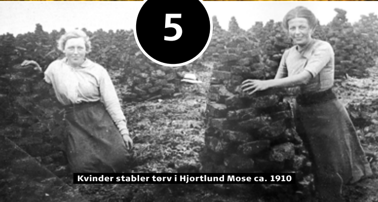
Kvinder stabler tørv i Hjortlund Mose ca. 1910