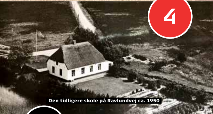
Den tidligere skole på Ravlundvej ca. 1950