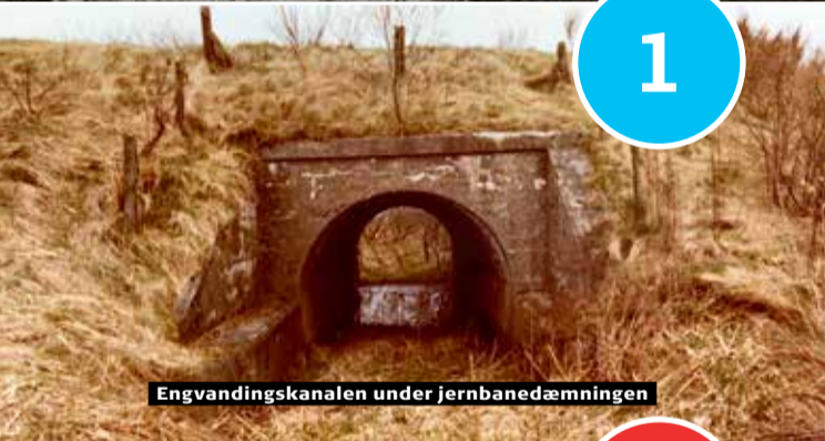
Engvandingskanalen under jernbanedæmningen