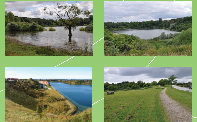
De to kridtgrave, som man kommer forbi på kridtgravsruten