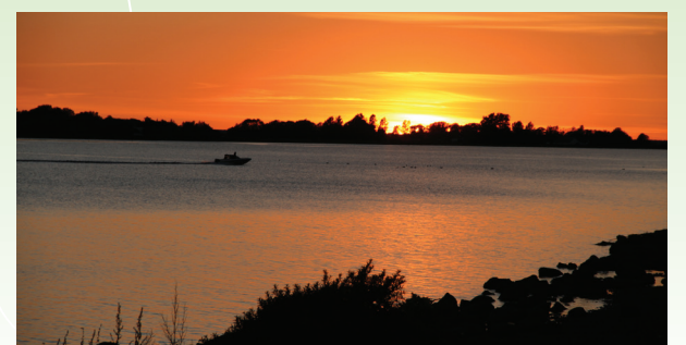
Limfjorden, Lindholm Strandpark og shelteren i Lindholm Fjordpark