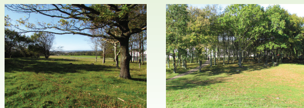
Lindholm Høje og den flotte natur i området