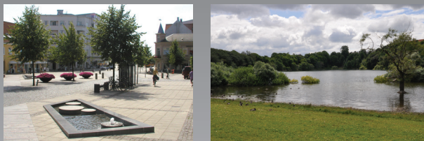
Lindholm Høj, Nørresundby Apotek, Nørresundby Torv og Solsideparken

Velkommen på Kløverstierne, som er for dig, der vil ud i det fri og kombinere oplevelser og frisk luft med motion. Vælg den rute, der passer dig i forhold til længde eller seværdigheder. Vælg mellem den grønne rute på 2½ km, den blå på 5, den røde på 7½ eller den sorte på 10 km. Her i folderen kan du lade dig inspirere til valg af rute og bruge den som en guide undervejs.