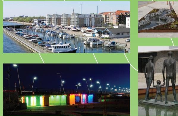
Nørresundby lystbådehavn, brolandingen og Sundby Brygge