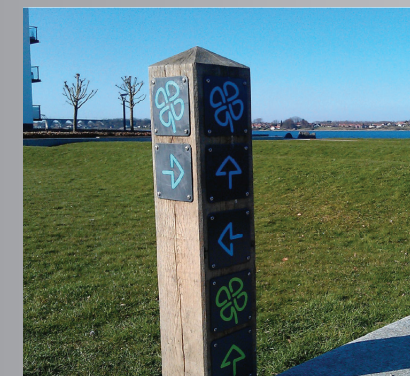
Eksempel på skiltning

På Endomondo's mobilapp, ligger ruterne med billeder og beskrivelser af spændende lokaliteter undervejs. Disse er markeret på kortet. App'en kan du hente i App Store eller på Google Play.