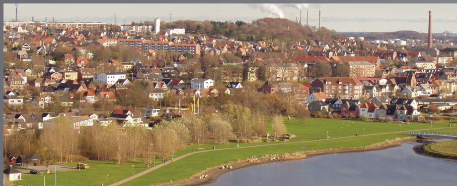
Lindholm Strandpark og udsigten over Nørresundby