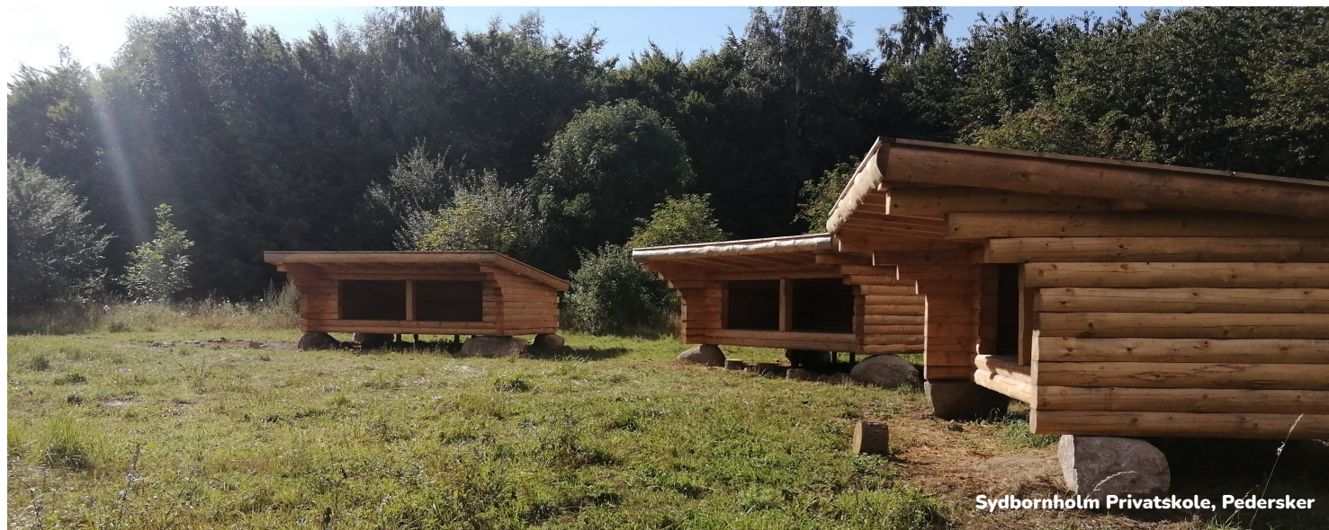
Sydbornholm Privatskole, Pedersker