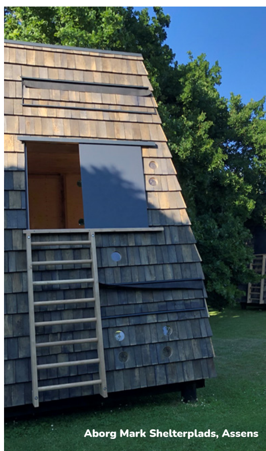
Aborg Mark Shelterplads, Assens