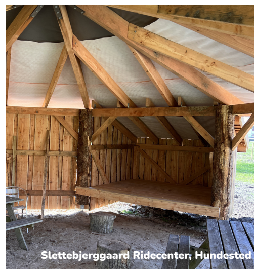
Slettebjerggaard Ridecenter, Hundested