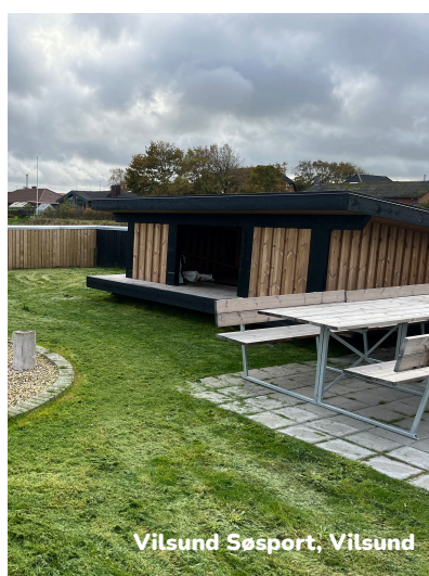
Vilsund Søsport, Vilsund

”Vi har allerede nu fået mange positive tilbagemeldinger fra forskellige besøgende.”