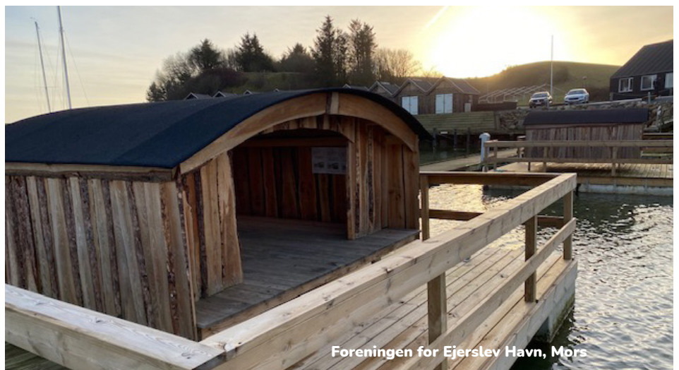
Foreningen for Ejerslev Havn, Mors