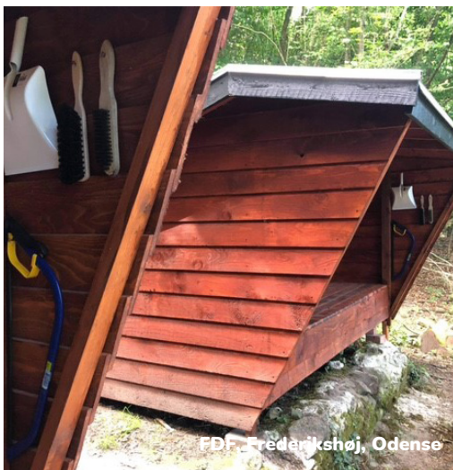
PDF, Frederikshøj, Odense