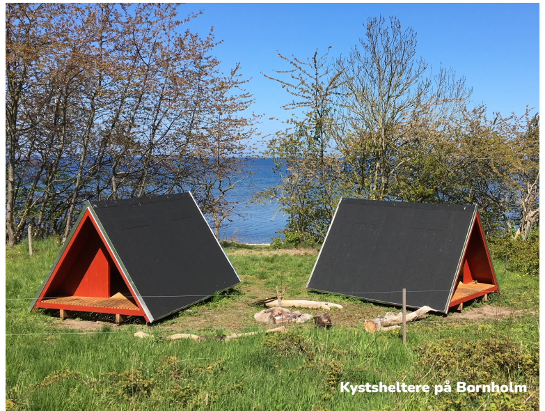
Kystsheltere på Bornholm