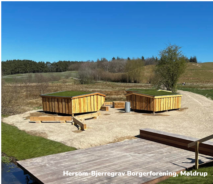
Hersom-Bjerregrav Borgerforening, Møldrup